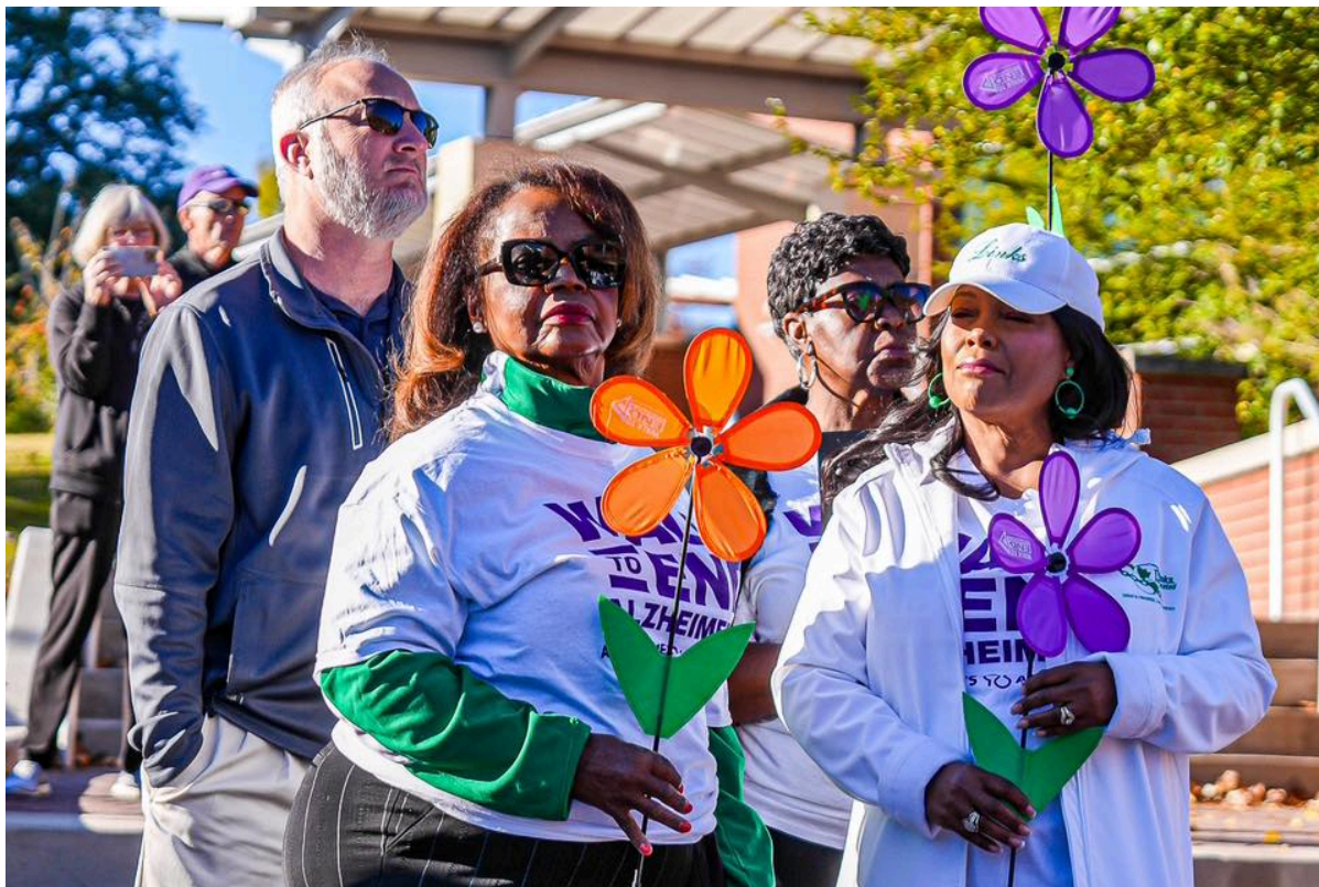
Marche pour la maladie d'Alzheimer 2023 à la Middle Georgia State University le 21 octobre 2023.

L'Alabama avait déjà créé un groupe de travail similaire en 2012 qui a finalisé en 2015 un plan pour lutter contre la maladie d'Alzheimer. Il s'agissait de développer un programme visant à fournir des services aux patients et aux soignants en coordonnant les efforts entre les différentes agences d'État. Il a permis la mise à jour et l'amélioration de la formation sur la démence destinée au personnel des hôpitaux et des maisons de retraite.